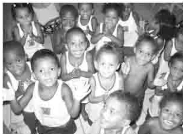
Crianças da Creche também receberão atendimento

Com a proposta de trabalhar a dimensão psicológica da comunidade de baixa renda de Piafã e bairros circunvizinhos, como Alto do Coqueirinho e Bairro da Paz, os profissionais do Núcleo de Psicologia da Fundação Lar Harmonia estão